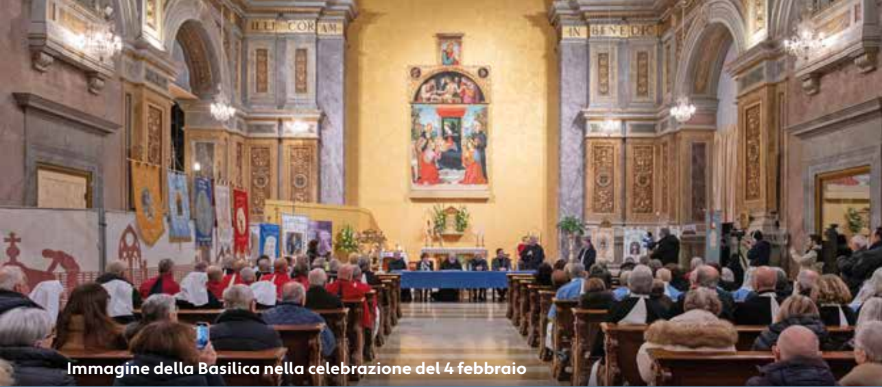
Immagine della Basilica nella celebrazione del 4 febbraio