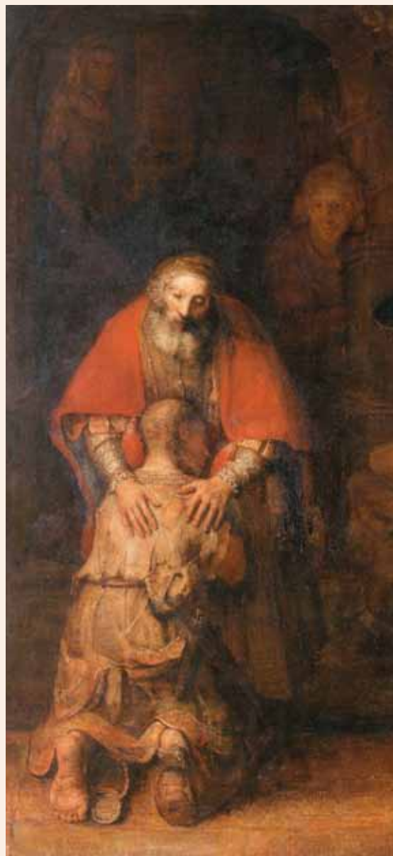
Rembrandt, Il figliol prodigo (1668), pittura a olio su tela, San Pietroburgo, Museo dell'Ermitage

Agostino si esprime così: «La prima libertà consiste nell'essere immuni da colpe gravi... Quando uno comincia a non avere questi crimini (e nessun cristiano deve averli), comincia