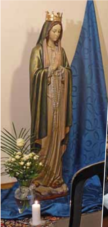
Foto 12 1° maggio. Inizia il mese mariano durante il quale i giovani ogni sera, alle 21.30, si ritrovano per recitare insieme il santo rosario.