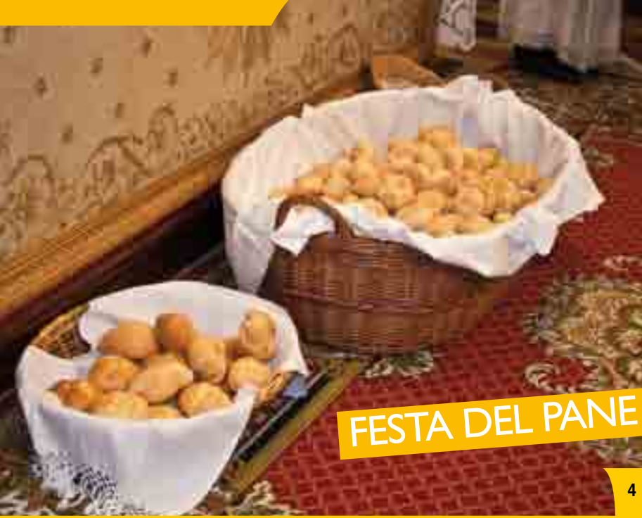
Foto 4 Panini benedetti.