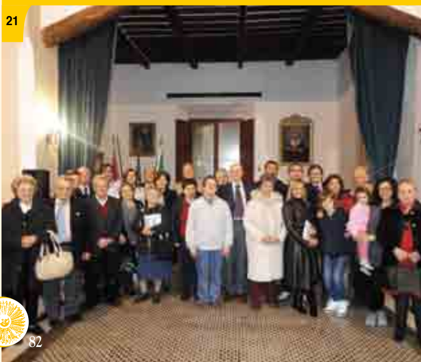
Foto 21 - 29 aprile. Nelle sale del Convento abbiamo ospitato la Conviviale del Rotary Club di Tolentino. I fondi raccolti sono stati devoluti in favore di otto ragazzi disabili del Comprensorio, per permettergli di partecipare per una settimana al "Rotary Campus Disabili" al Natural Village di Porto Potenza Picena.