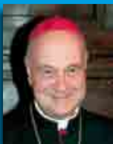
S. E. Card. Angelo Comastri Vicario Generale di Sua Santità per la Città del Vaticano