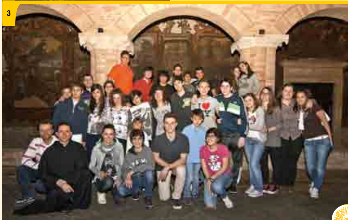
Foto 3 28 marzo-9 aprile. Giovani della Vicaria di Tolentino vivono un'esperienza di vita insieme con la Comunità Agostiniana.