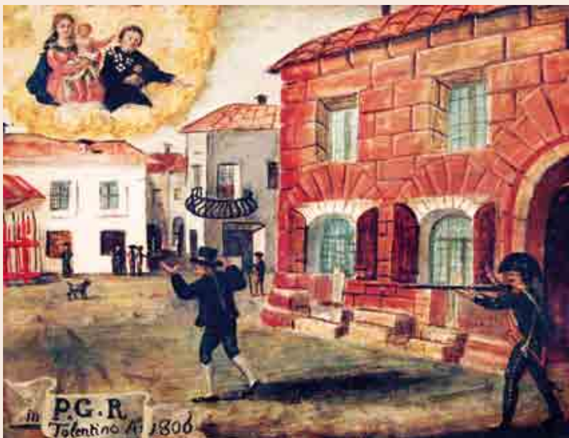
Tolentino, un cittadino ferito alle spalle da un soldato francese si raccomanda alla Vergine col Bambino e san Nicola. Museo degli ex voto, Basilica di San Nicola.