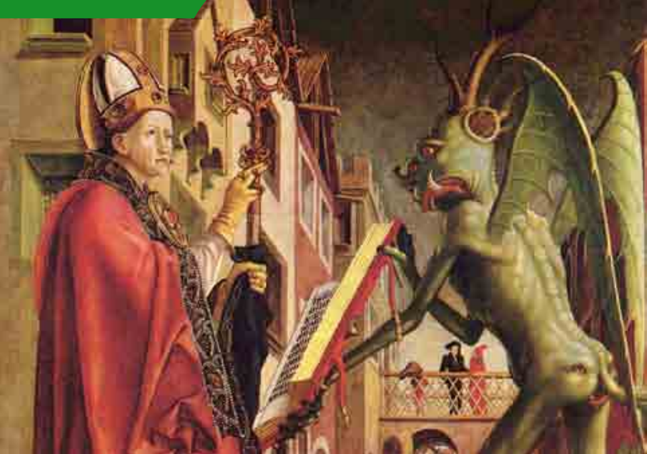
Michael Pacher (1435-1498), Satana mostra il libro dei vizi a Sant'Agostino , Alte Pinacothek, Monaco

si è fatto solidale con i peccatori per condurli alla salvezza.